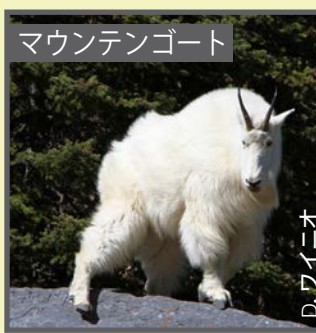
マウンテンゴート