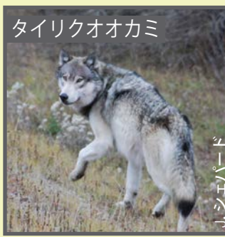
タイリクオオカミ