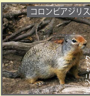
コロンビアジリス