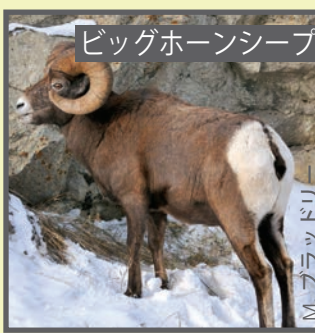
ビッグホーンシープ