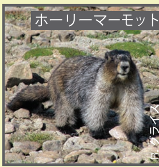
ホーリーマーマット